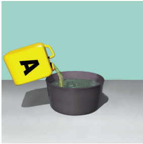
Cho 5 lít thành phần A (lỏng) vào thùng trộn