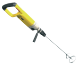
Máy trộn điện tốc độ chậm