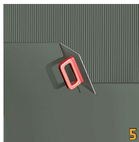
Thi công lớp thứ hai theo phương vuông góc với lớp thứ nhất.