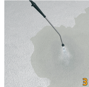
Làm ẩm bảo hòa bề mặt nhưng không để đọng nước.