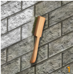
Vệ sinh sạch và làm nhám bề mặt cần chống thấm