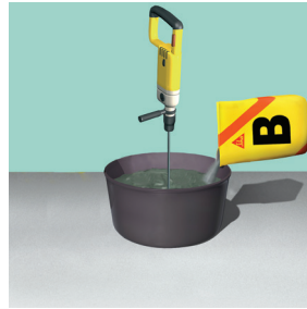
Cho từ từ 20 Kg thành phần B (bột) vào và khuấy đều (~3 phút)